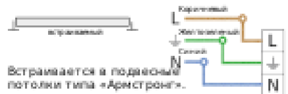
Схема крепления / подключения