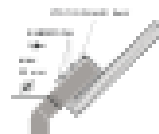
Схема крепления / подключения